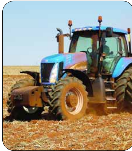
Klante kan steeds dieselfde goeie diens as in die verlede van NWK en New Holland verwag.

bemark word. New Holland SA is nou ook deel van 'n groter maatskappy wat op die aandeelbeurs genoteer is," sê Dirk.