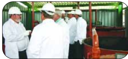
Die Direkteure het na afloop van die Direksievergadering in Februarie ‘n draai by die aanleg gemaak om hulself van die prosesse te vergewis.

NWK gebruik reeds sedert middel-September verlede jaar biodiesel in een van hulle bakkies en beplan om ook een van hulle vragmotors om te skakel om die effek van die biodiesel op die vragmotor se enjin te toets.