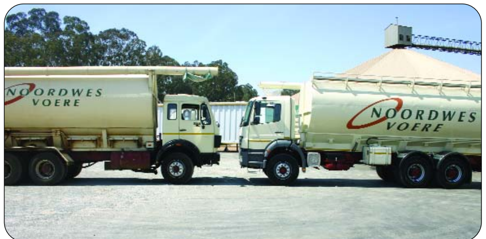
Die ou Buksie (links) het bykans 1,2 miljoen km afgelê en is in Oktober verlede jaar met die nuwe Buks (regs) vervang wat gebruik gaan word om losmaat-veevoere mee te vervoer.

NWK Vervoer lewer ook 'n diens aan eksterne klante (buite die NWK Groep) en vervoer onder andere graan en implemente vir klante. Skakel gerus die departement by (018) 632-4565 vir 'n vervoertarif of gratis vervoerlogistieke advies.