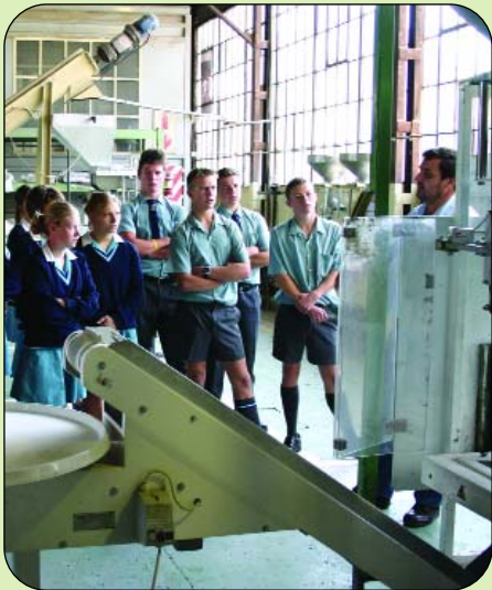
Die leerders van Lichtenburg CVO skool tydens hul besoek aan die Noordfed-aanleg.