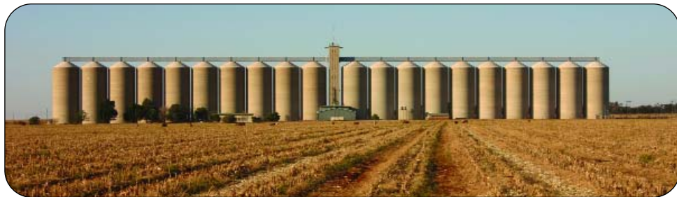
Om graan vir lang periodes veilig op te berg, vereis geskikte fasiliteite en kundigheid – soos wat by konvensionele graansilostrukture beskikbaar is.

'n Deeglike studie is nodig om alle risiko's vir opberging in silosakke te bepaal en onder Suid-Afrikaanse klimaattoestande te evalueer voordat op groot skaal hiervan gebruik gemaak kan word.