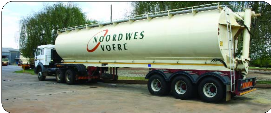
Kyk gerus uit vir dié spoggerige nuwe tenkers van Noordwes Voere.

Die nuwe tenkers sal hoofsaaklik, maar nie uitsluitlik nie, vir die aflewering van braaikuikenvoer gebruik word. Die grootste gedeelte van Noordwes Voere se tonnemaat word binne 'n radius van 80 km om die fabriek op Lichtenburg gelewer, maar sommige vragte word meer as 200 km ver afgelewer.