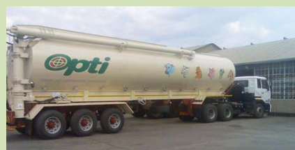
Noordwes Voere se nuwe 28 ton tenker.

Die twee-as (22 ton) tenker by Noordwes Voere is met ’n drie-as (28 ton) tenker vervang. “Die opgradering van ons vragmotorvloot vorm deel van ’n vervangingsprogram,” het Anton gesê.