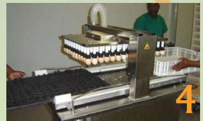
4 Die eiers word vanaf die eierlaaie na die eiermandjies oorgeplaas.