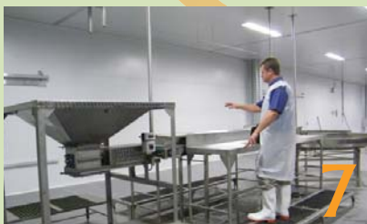
7 Die macerator.