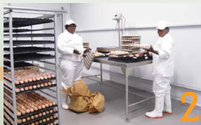
2 Die gradering van die eiers word gedoen voordat dit na die broeikamers oorgeplaas word.