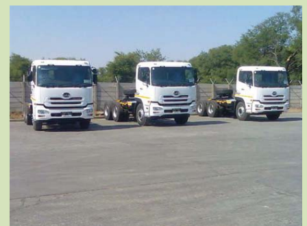
Die drie nuwe Nissan UD 460 voorspanvragmotors wat NWK Vervoer in ontvangs geneem het.