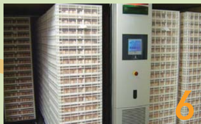
6 Die kratte met die kuikens binne die kuikenkamers.