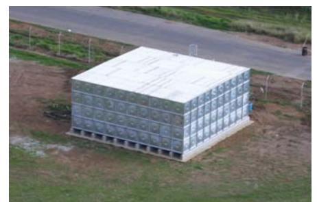
Die watertenk bied definitief 'n oplossing vir Epko, Noordwes Voere en Vloeibare Kunsmis.

Gelukkig het NWK 'n alternatiewe plan vroeër vanjaar in plek gehad deur 'n wateropgaartenk op te rig, omdat bogenoemde bedrywe water in meeste van hulle prosesse gebruik. "Die tenk is opgerig om 'n krisis te vermy wanneer daar nie watervoorsiening soos onlangs was nie. Water word dan vanaf die tenk aan die aanlegte voorsien," het FP Dafel (prosesingenieur: Epko) gesê.