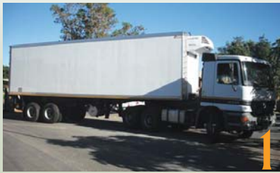
1 NWK Vervoer se eiertrok wat die eiers van die plaas na die broeiery vervoer. Dié Opti Chicks handelsmerk gaan nog daarop aangebring word.

Ongeveer 500 000 kuikens sal per week by die broeiery opgelaaï word. NWK het 'n leweringsooreenkoms met Rainbow Chickens en die res sal aan diverse groeiers verkoop word.