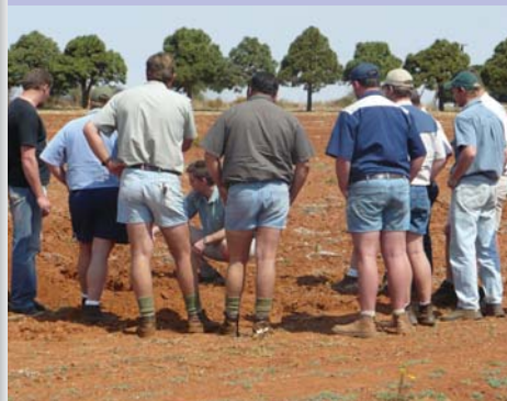
Van die produsente tydens 'n praktiese grondontledingsessie by die NWK Omnia opleidingsdag.

Die dag is deur ongeveer 30 produsente bygewoon. Indien daar 'n verdere behoefte vir sulke tipe opleidingsdae is, skakel jou naaste NWK Omnia-agent of landboukundige.