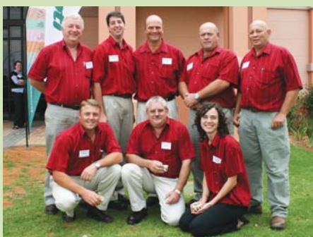
Die Noordwes Voere span wat produsente van regoor die land by die suiweldag by Rio Casino in Klerksdorp verwelkom het.