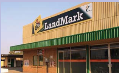
Die winkel op Mareetsane van buite gesien.