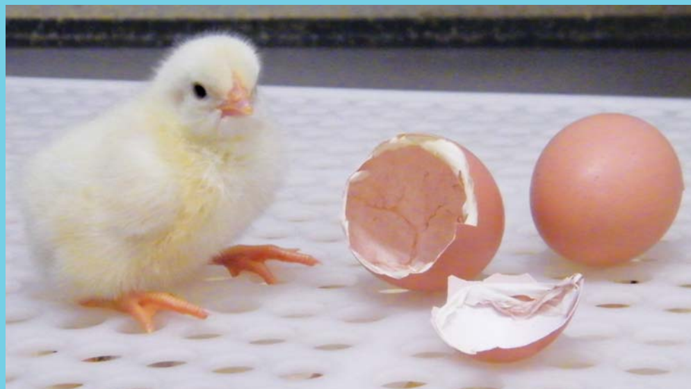
Een van die eerste kuikens wat by die Opti Chicks broeiery uitgebroei het. Die eiers word in die kuikenkamers in kratte gehou, totdat al die eiers uitgebroei het.

Wanneer die eiers afgelaai word, word dit gegraadeer en vanaf die plaas- na die broeierytrollies oorgeplaas. Die broei-eiers word in die eierkamers tussen 17°C en 18°C gestoor, voordat dit in die broeikamers geplaas word. Die uitskoteiers word aan die mark verkoop . ▶ 3