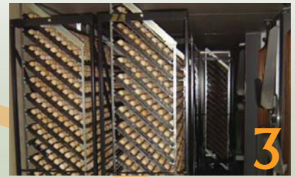
3 Die trollies in die broeikamers bevat elk 4 800 eiers en 24 sulke trollies pas in die kamers.