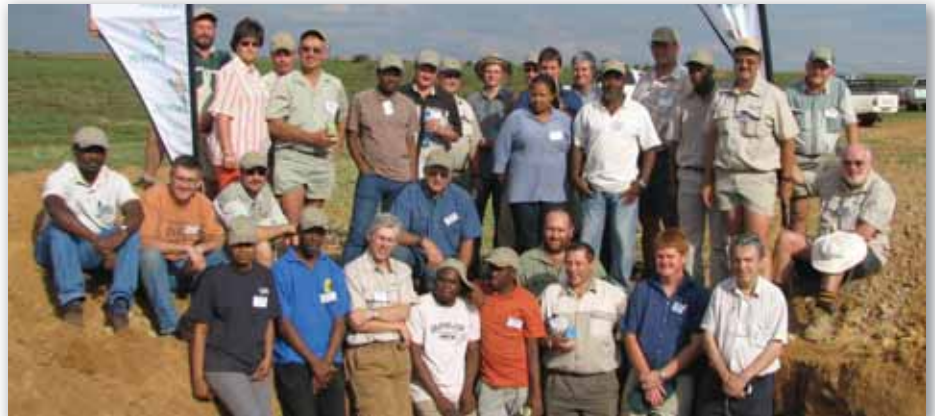
SAGO-lede by 'n profielgat tydens die Lichtenburg-werkswinkel.

Vir verdere inligting kan SAGO se webtuiste by www.sasso.co.za besoek word.