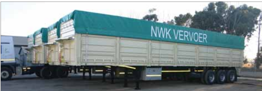
Dié nuwe leunwaens van NWK-Vervoer sal hoofsaaklik vir die vervoer van sonneblom en mieliekiem aangewend word.

Skakel NWK-Vervoer by (018) 632-4565 vir 'n vervoerkwotasie en/of vragvervoer advies.